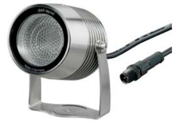
clarios (Edelstahl • stainless steel • acier inoxydable)